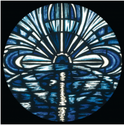
er zij licht