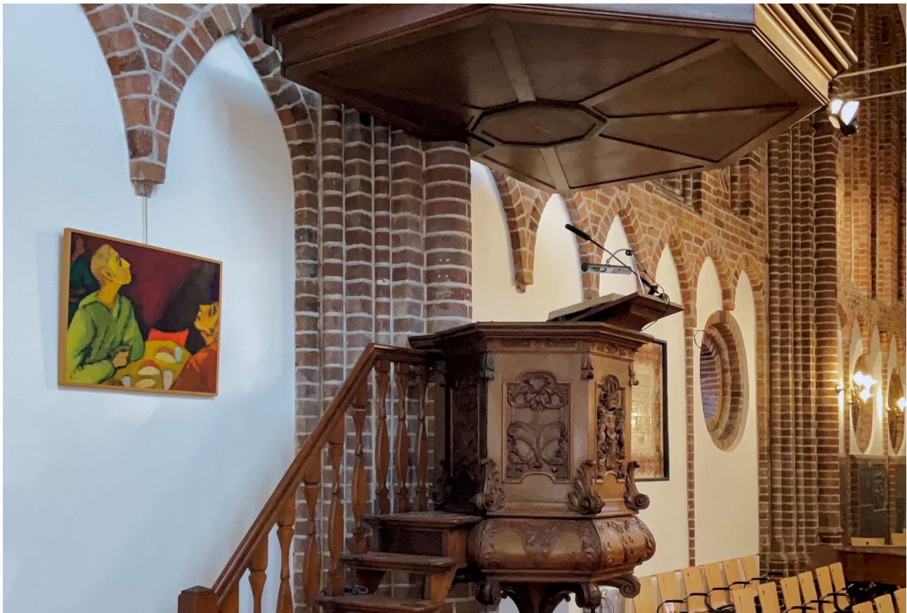
openmonumentendag

Dankzij die verbouwing kan nu de Protestantse Gemeente Winschoten, per 1 januari 2006 ontstaan door de fusie van de Hervormde Gemeente en de Gereformeerde Kerk van Winschoten, in de Marktpleinkerk samenkomen. (en sinds 2023 als wijk van Protestantse Gemeente Oost-Groningen). Samen onder één dak; een dak dat in 2007 tijdens de voorlopig laatste restauratie ook al weer gerestaureerd werd.